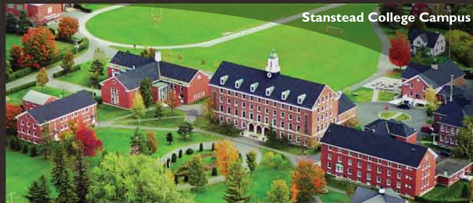
Stanstead College Campus

โรงเรียนของเรา ก่อตั้งเมื่อปีค.ศ. 1872 มีระดับชั้นตั้งแต่เกรด 7-12 นักเรียนประจำและนักเรียนไปกลับ การเรียนการสอนเป็นภาษาอังกฤษ มีการสอนภาษาฝรั่งเศสในทุกระดับ กีฬาทั้งในและนอกหลักสูตร ศิลปะ ดนตรี และการแสดง กิจกรรมชมรมกว่า 20 ชมรม กิจกรรมสุดสัปดาห์ที่หลากหลาย มีโครงการแลกเปลี่ยนต่างประเทศ